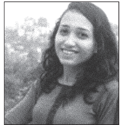
समय-सन्देश शिर्जना गौतम

व्यवहार र व्यक्तित्व विकासमा पर्ने असरहरू मिडियामा देखाइएको हिंसा मनोरञ्जनका लागि मात्र भनिए पनि यसको प्रभाव मानिसमा