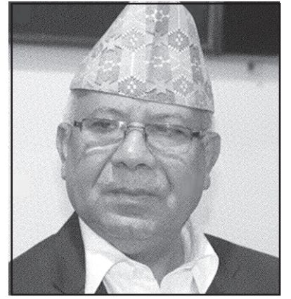
दस्तावेज माधवकुमार नेपाल

त्यसैले कमिटी निर्माण अभियान जारी राख्नु पर्छ र आगामी चैत १५ गतेसम्म सबै पालिकाका सम्पूर्ण वडा र सकेसम्म टोल तहसम्म पार्टी र जनसङ्गठनका कमिटीहरू निर्माण गरिसक्नु पर्दछ।