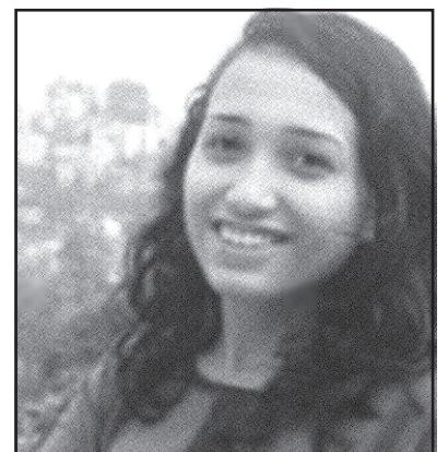
समय-सन्देश शिर्जना गौतम

लगभग ईसा पूर्व ६०० तिर शुरूवात भएको यस दर्शन १२औं शताब्दीसम्म चर्चित भए तापनि त्यसपछि कुनै निशान नछोडी हराएको