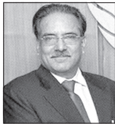
दस्तावेज पुष्पकमल दाहाल 'प्रचण्ड'

यो दुई महिना हामीले बल गरेर यो अभियानलाई लिएर जनताको घरमै बस्ने, समस्या सुन्ने, घाइते अपाङ्गको अवस्था कस्तो छ, त्यो सुन्ने । यद्यपि अहिले सहिद परिवार र घाइतेलाई अर्थ मन्त्रालयबाट एउटा प्याकेज प्रोग्राम आएको छ, त्यसलाई कार्यान्वयन गर्दा जनतालाई राम्रो राहत हुन्छ । त्यो कुरा पनि बताउने हामीले । हामी जनताको घरघरमा गएर आत्मसमीक्षा गर्ने । 'हामी आफ्नो उद्देश्यबाट थोरै विचलित भयौं, तर हामीले महसुस गर्नुपर्छ कि हामी तपाईंहरूकै छोराछोरी हौं, तपाईंहरूको सेवा गर्न हिँडेकै हो हामी, फेरि पनि तपाईंहरूकै सेवामा समर्पित हुन चाहन्छौं, यो परिवर्तन तपाईं-हामी सबै मिलेर आएको हो, यसलाई जाली-फटाहाले उल्ट्याउन खोजेका छन्, हामी यसलाई उल्ट्याउन दिँदैनौं, तपाईंहरूले फेरि एक पटक हामीलाई साथ दिनुपर्छ' भनेर हामी आत्मसमीक्षासहित प्रस्तुत भयौं भने देशैभरी, ७७ वटै जिल्लामा जनताको मन जित्नसक्ने हैसियत हाम्रो अझै पनि कायम छ । त्यसकारण तपाईंहरूले अहिलेदेखि नै योजना बनाउनु पर्छ । यो निर्वाचनको ब्याटल हामीले जित्ने पछि ।