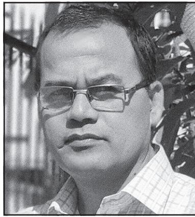
साहित्य/कथा कमल निग्रोल

नगागिरहन स्पर्श गर्छन् उनले आफ्ना दारी, देखने जो कसैलाई लोभ नलागिरहन सक्दैन।